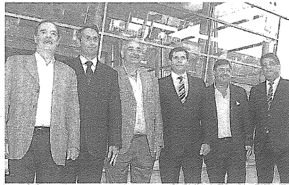
Autoridades, presentes EXPOTRADE

El nuevo concesionario contó con la presencia de autoridades de Pesados Central, de Volkswagen Argentina, clientes e invitados especiales.