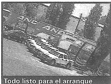
Todo listo para el arranque