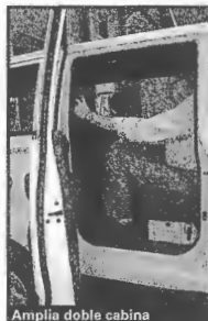
Amplia doble cabina