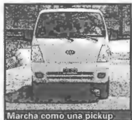
Marcha como una pickup.

El Kia K2700 II 4x4 resulta especialmente apto para las tareas realizadas en terrenos con obstáculos, como ocurre en el agro, la minería y la construcción.