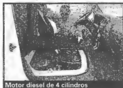
Motor diesel de 4 cilindros

El Kia K2700 II 4x4 resulta especialmente apto para las tareas realizadas en terrenos con obstáculos, como ocurre en el agro, la minería y la construcción.