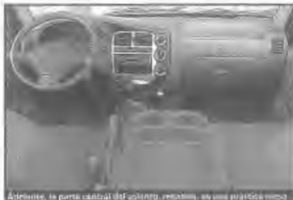
Además, la parte central del volante, reclinable, es una gran ayuda.