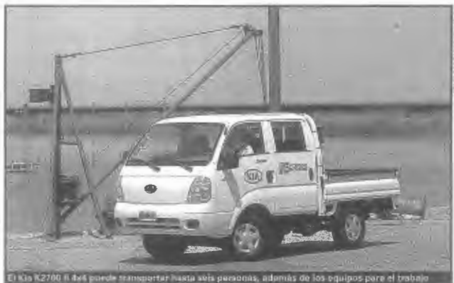
El Kia K2700 II 4x4 puede transportar hasta seis personas, además de los equipos para el trabajo