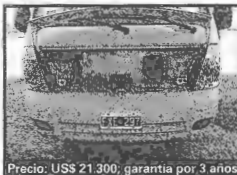
Precio: US$ 21.300, garantía por 3 años.

de suspensión cuando la caja de carga está vacía.