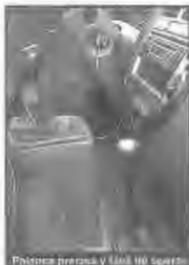
Palanca precisa y fácil de operar.