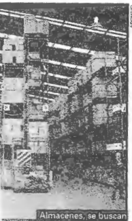
Almacenes, se buscan

antes del sistema. La mayor preocupación estará en aumentar la integración entre los distintos eslabones de la cadena, muy declamado y poco efectivizado, lo cual permitirá minimizar incertidumbres y funcionar eficientemente".