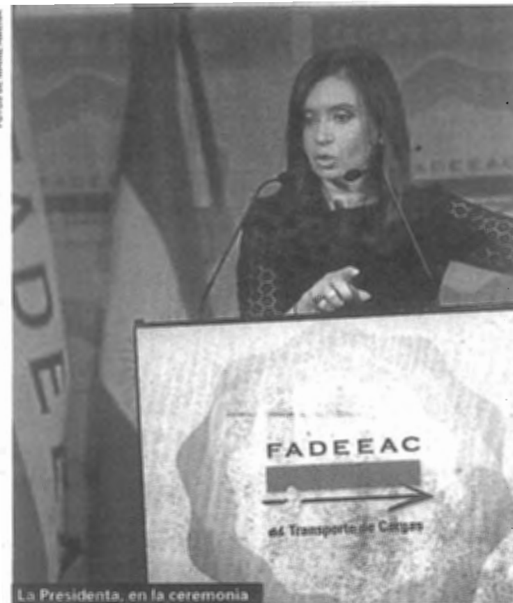
La Presidenta, en la ceremonia

Morales no dejó pasar por alto la oportunidad de notificarle a la Presidenta las dificultades por las que atraviesa el sector con la existencia en el mercado de dadores de carga que "abusando de su posición dominante fijan condiciones y tarifas que, en reiteradas ocasiones, obligan a los transportistas a prestar servicios por debajo de los costos de explotación"; un sistema que aún funciona con 80.000 camiones con más de 30 años de vida útil que representa un desafío por revertir; la caída de los volúmenes transportados en 2009 por la histórica sequía