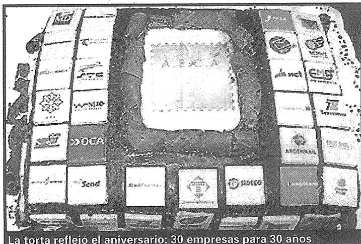
La torta reflejó el aniversario: 30 empresas para 30 años

AECA reúne a 30 compañías asociadas que representan un 40% del mercado postal total y a casi un 70%