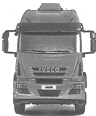
Hecho en Córdoba

de potencia, con 1200 Nm de torque ofrecidos por sus 7,8 litros de cilindrada, con una arquitectura compuesta por cuatro válvulas por cilindro, árbol de levas a la