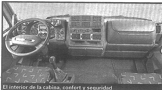
El interior de la cabina, confort y seguridad

Fue equipado con el nuevo motor Iveco Cursor 8 de 324 caballos