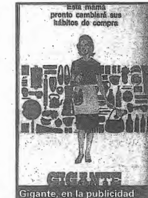
Gigante, en la publicidad

Ocupaba una superficie total de 21.000 m 2 , de los cuales 7200 m 2 eran áreas de ventas y 6000 m 2 para estacionamiento. El resto comprendía depósitos, departamentos de preparación, fraccionamientos y oficinas. Por Alvarez Jonte estaba la entrada de obreros y empleados,