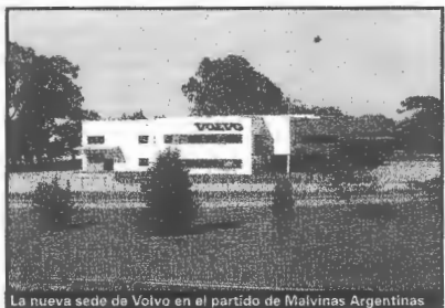
La nueva sede de Volvo en el partido de Malvinas Argentinas

La nueva planta de ventas y servicio, que comenzó a levantarse en enero de este año, tiene un área comercial de venta de vehículos y depósitos de repuestos, un salón de eventos, instalaciones destinadas a la capacitación para sus técnicos, restaurante y sala de recreación, oficinas administrativas y comerciales, lavadero de vehículos y talleres que incluyen fosa con capacidad