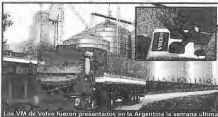
Los VM de Volvo fueron presentados en la Argentina la semana última