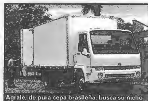
Agrale, de pura cepa brasileña, busca su nicho

Las otras presentaciones estelares de la marca de origen italiana, que en total mostró ocho nuevos productos, fueron para el trabajo fuera de carretera. La primera fue la de los robustos camiones Iveco Trakker 380T38 (380 CV) y 720T42 (420 CV) con tracción 6x4 para obras y construcción, equipados con el propulsor Cursor 13.