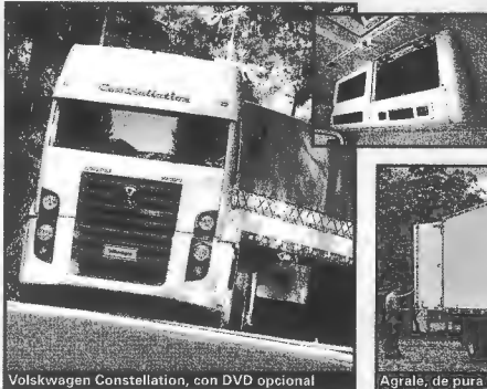
Volkswagen Constellation, con DVD opcional