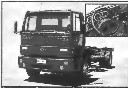
Ford y sus nuevos Cargo con motores electrónicos de baja polución