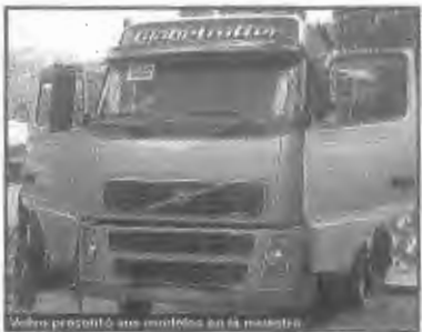
Volvo presentó sus camiones en la muestra.

acompañada por empresas referentes del sector nacionales y extranjeras", agregó el directivo.