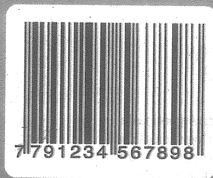
CÓDIGO DE BARRAS