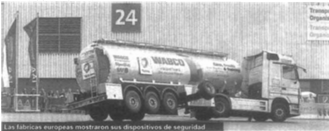
Las fábricas europeas mostraron sus dispositivos de seguridad