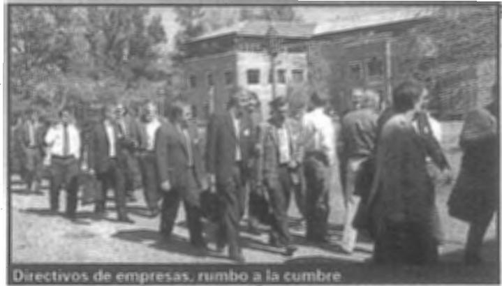
Directivos de empresas, rumbo a la cumbre

De ese sondeo, que fue completado por cerca de 200 referentes del sector y luego analizado por los académicos del IAE Business School, surgieron cuáles son los puntos más acuciantes en distintas dimensiones, como infraestructura y entorno, integración interna, integración con clientes y proveedores, outsourcing e internacionalización, sobre las que se trabajó en talleres presenciales. ■ Mejorar el sistema de transporte ferroviario y de carreteras resultó prioritario para el 60% de los empresarios encuestados, quienes puntualizaron entre los problemas más graves, los tiempos de tránsito excesivo ocasionados por cortes de