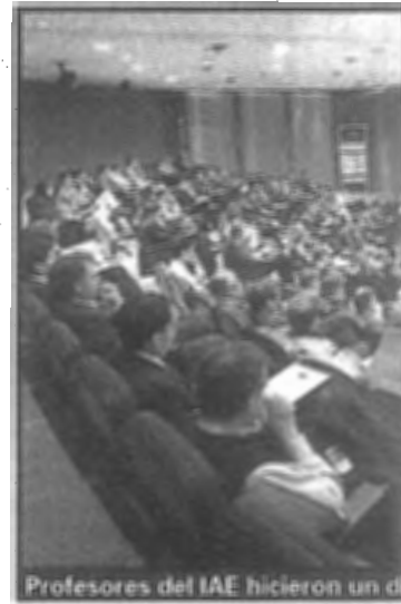
Profesores del IAE hicieron un d

De las primeras impresiones que los académicos recogieron al finalizar esa jornada de talleres, emergieron tres ejes: la importancia de continuar este trabajo conjunto para definir acciones a futuro; la necesidad de revisar internamente la práctica de gestión de cada empresa y los aspectos de la cadena en su conjunto, así como estar al día con las novedades que puedan provenir del sector público, y la conveniencia de promover la revalorización del