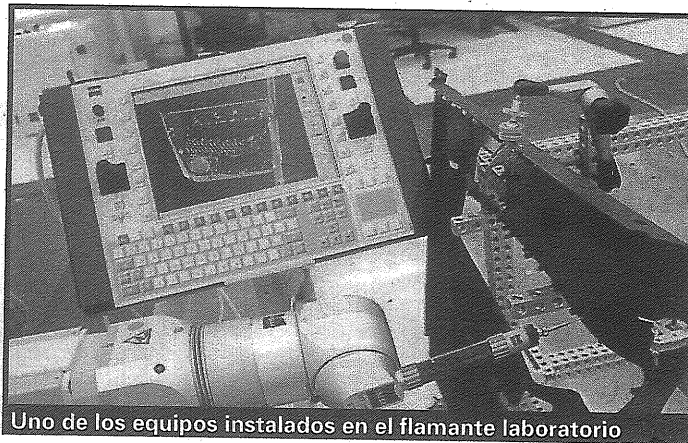
Uno de los equipos instalados en el flamante laboratorio

en la atracción de inversiones. Unido a esto, el proyecto permite a la Facultad de Ingeniería formar a sus profesores y alumnos en el campo práctico, generar proyectos de investigación académicos y fortalecer el vínculo con las empresas”, informaron en la universidad.