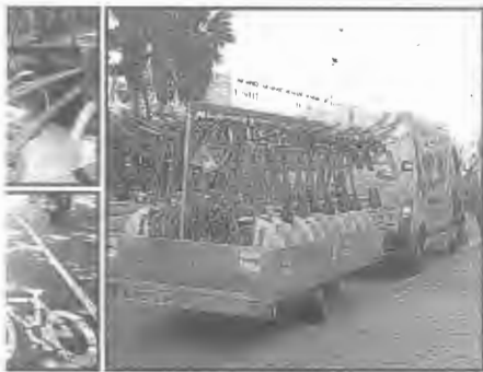
Operación de los usuarios registrados en sitios satelitalesmente de estaciones de subte y estacionamientos públicos. Se trata de un sistema que detecta el movimiento y la seguridad. Los usuarios reciben tarjetas de bicicletas especialmente diseñadas para ser validadas en estaciones de subte y peatonal. En Barcelona, el Bicing ya tiene más de 100.000 usuarios, bastante más que los 15.000 previstos originalmente.

Para poder acceder al servicio es necesario hacer un depósito de garantía de 150 euros. Para el abono de un año, por ejemplo, se acepta la extensión de un cheque que no se hace efectivo si no viola ninguna de las normas fijadas en las Condiciones Generales de Acceso y Utilización de Vélib'". Contando sólo las principales ciudades que disponen de servicios como éste,