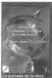
La portada de la obra

perante debe ser win-win (las dos partes deben "ganar"); tener claro cuáles son las variables principales de la ecuación económica que vincula al operador y al dador y los límites admisibles de variación de esas ecuaciones.