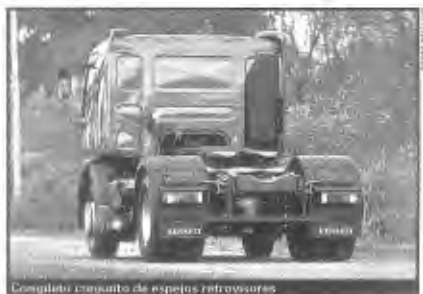
Completo conjunto de espejos retrovisores

El PBT de este Renault es de 19 toneladas, mientras que el PBTc es de 45. La tara llega a los 6692 kilogramos. El eje