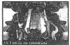
11,1 litros de cilindrada