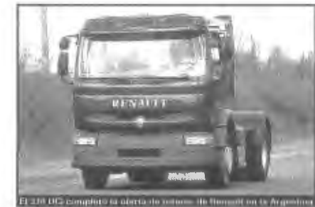
El 370 dCi completa la oferta de camiones de Renault en la Argentina.

El tren de fuerza continúa con la caja de velocidades ZF 16 S-151 OD (por OverDrive) de 16 marchas hacia adelante totalmente sincronizadas y dos reversas. Pensando en la comodi-