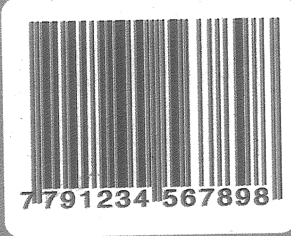
CÓDIGO DE BARRAS