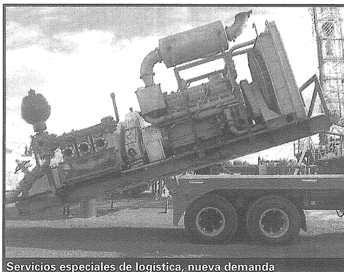
Servicios especiales de logística, nueva demanda

El dirigente empresario destacó que "todos esos emprendimientos mueven a la región muchos insumos, tanto bienes de capital como los necesarios para su funcionamiento vía carretera, desde el puerto de Buenos Aires o de Valparaíso.