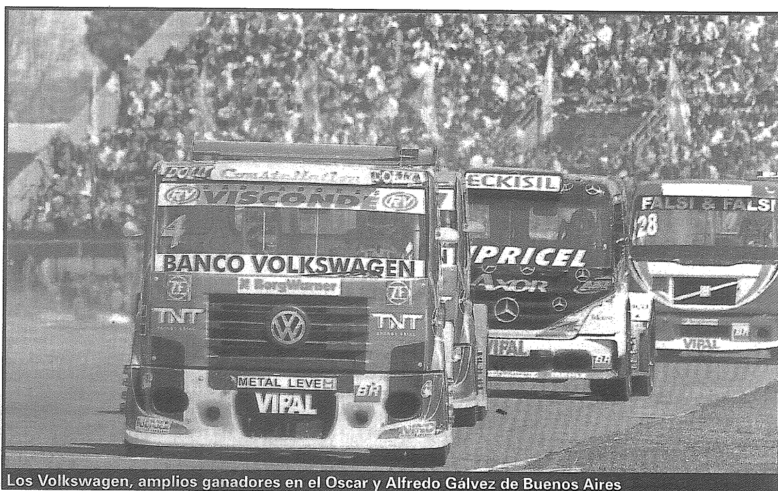
Los Volkswagen, amplios ganadores en el Oscar y Alfredo Gálvez de Buenos Aires

vía al frente de la categoría). Félix no sólo fue uno de los primeros competidores, también hasta su muerte efectuaba un espectacular show de derrapes y neumáticos quemados antes de cada competencia que hacía delirar a la torcida.