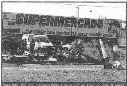
Hace diez días, dos militares fallecieron al caer un avión en Villa de Mayo