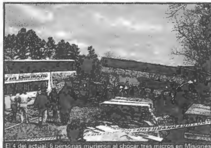
El 4 del actual, 6 personas murieron al chocar tres micros en Misiones

Septiembre viene siendo especialmente trágico en materia de accidentes de tránsito con participación de camiones y micros. Y así lo viene consignando LA NACION. La semana pasada, en uno de los incidentes más recientes,