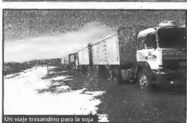
Un viaje trasandino para la soja