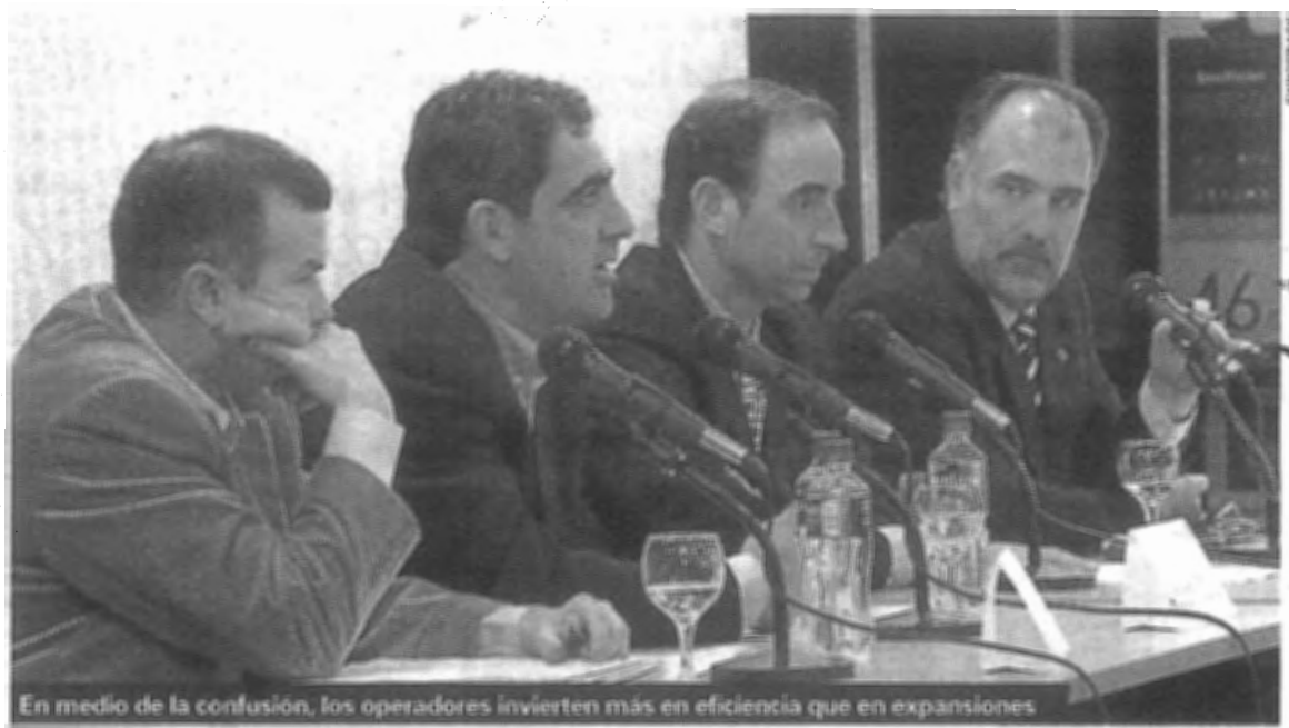
En medio de la confusión, los operadores invierten más en eficiencia que en expansiones