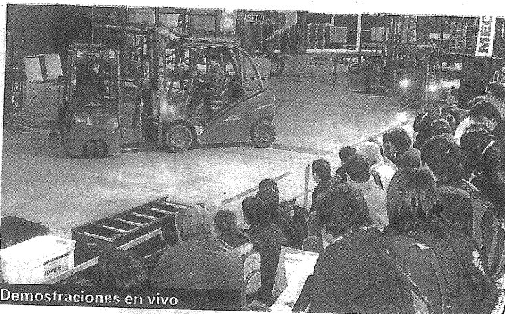
Demostraciones en vivo

la exposición, empresas vinculadas con la construcción, autoelevadores, vehículos industriales, embalaje, manipuleo de plantas, picking, software, zunchos, consultoras, automotrices y operadores logísticos, expusieron su oferta a los visitantes.