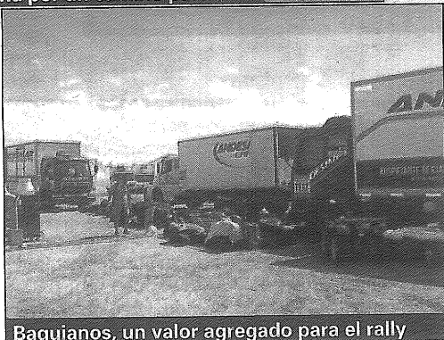
Baquianos, un valor agregado para el rally