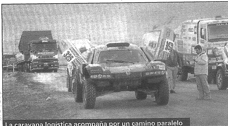
La caravana logística acompaña por un camino paralelo

Desde la firma argentina, justificaron la elección en su "fuerte presencia en el país, con bases operativas y unidades de respaldo en diversas localidades". "Para nosotros era una gran oportunidad participar en un acontecimiento de semejante complejidad y magnitud, en la que se combina el traslado de personas con el manejo de diversos tipos de carga (combustible, indumentarias, equipos de televisión, hospitales, co-