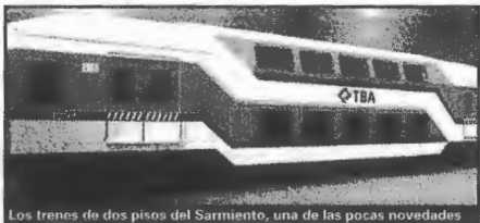
Los trenes de dos pisos del Sarmiento, una de las pocas novedades