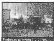
Fadecac proveerá viveres