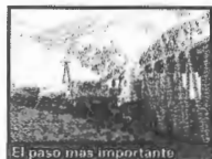
El paso más importante

Según explicó el investigador, el sistema informático se desarrolló específicamente para la ruta 7 y