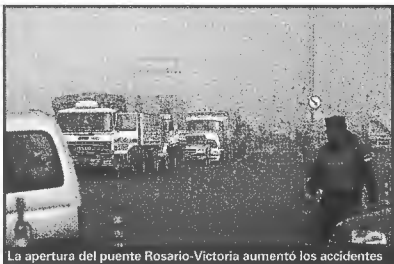
La apertura del puente Rosario-Victoria aumentó los accidentes