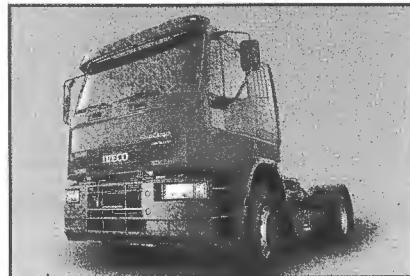
El nuevo EuroCargo, pensado para la demanda de la pampa húmeda

En materia de frenos, tema siempre importante en un camión de gran porte, a los de servicio (neumáticos