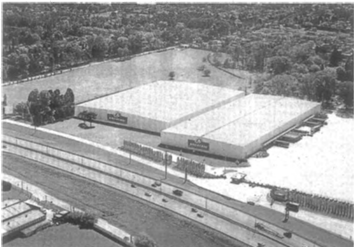
Según la Cámara Empresaria de Operadores Logísticos, la actividad crece a un 13%