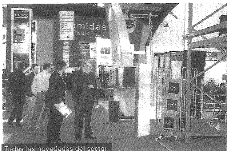
Todas las novedades del sector

Dentro de Expologisti-K 2010, la Asociación Argentina de Logística Empresaria (Arlog) ofrecerá su ciclo de conferencias cuyos ejes temáticos girarán en torno de los siguientes temas: la incidencia de la logística en el desempeño de las pymes; las inversiones en parques logísticos en la Argentina, Brasil y México; tecnología, sistemas, procesos y trazabilidad de productos; casos en la industria farmacéutica; productividad y costos en operaciones logísticas, y la seguridad y la piratería del asfalto. Alejandro