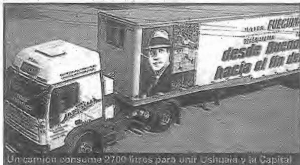
Un camión consume 2700 litros para unir Ushuaia y la Capital