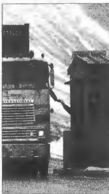
La frontera, sin complicaciones