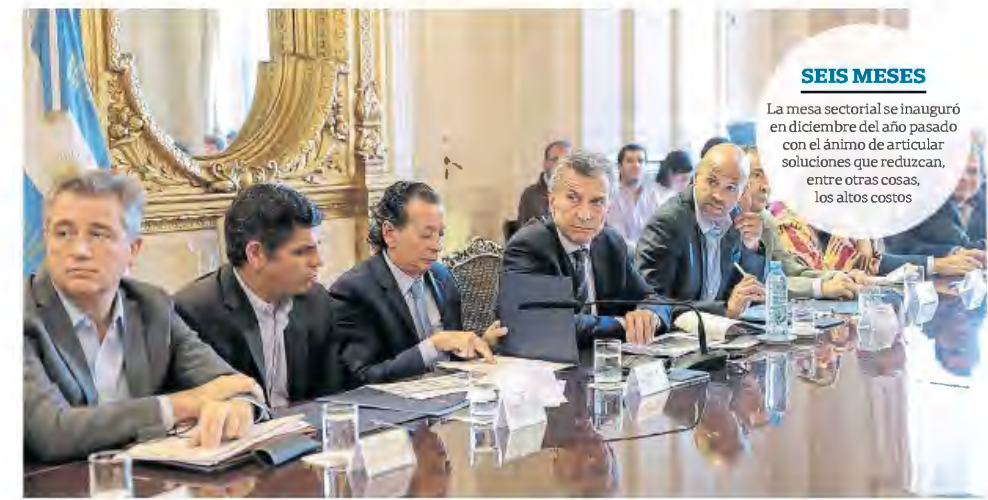
El presidente Mauricio Macri junto a funcionarios y referentes del sector empresarial logístico

Este nuevo ámbito tiene el propósito de que el Estado y los diferentes participantes dialoguen para que el sector sea motor del crecimiento económico y del comercio exterior. Las áreas de la producción, transporte a través de las empresas, las