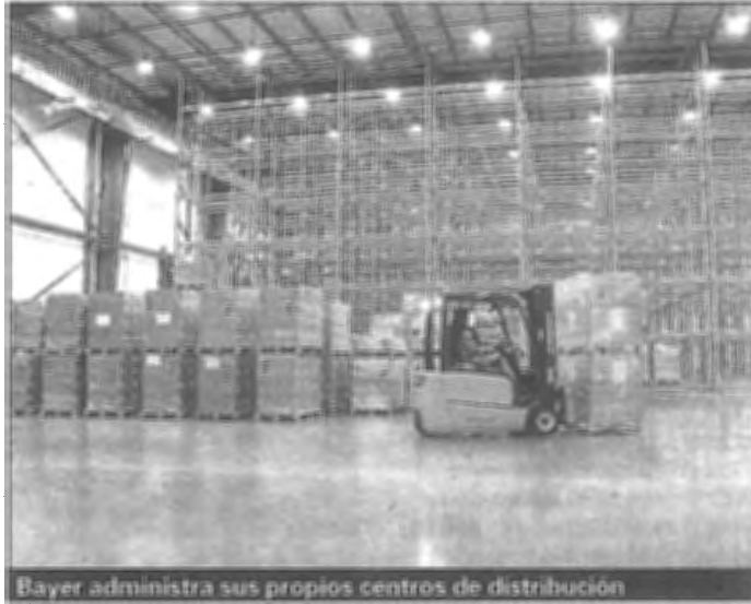
Bayer administra sus propios centros de distribución