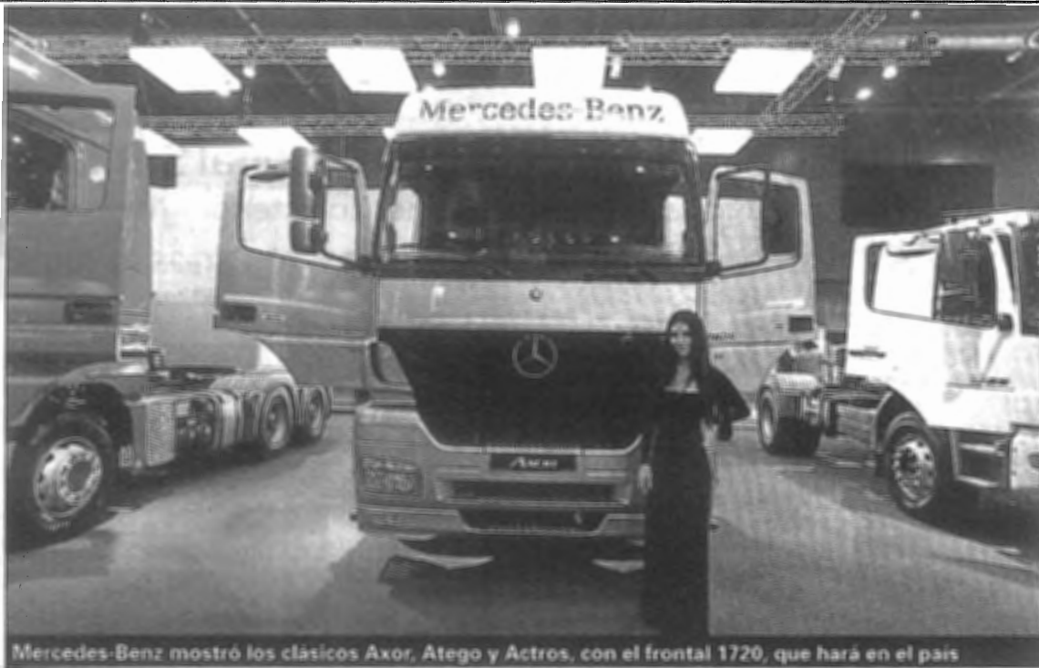
Mercedes-Benz mostró los clásicos Axor, Atego y Actros, con el frontal 1720, que hará en el país

lo convierte en el camión más potente del mercado argentino. Este modelo también derrocha tecnología de última generación con la transmisión Opticruise (automatizada, sin pedal de embrague ni selectora de cambios), y los dispositivos de ayuda a la conducción Driver Support y Retarder.