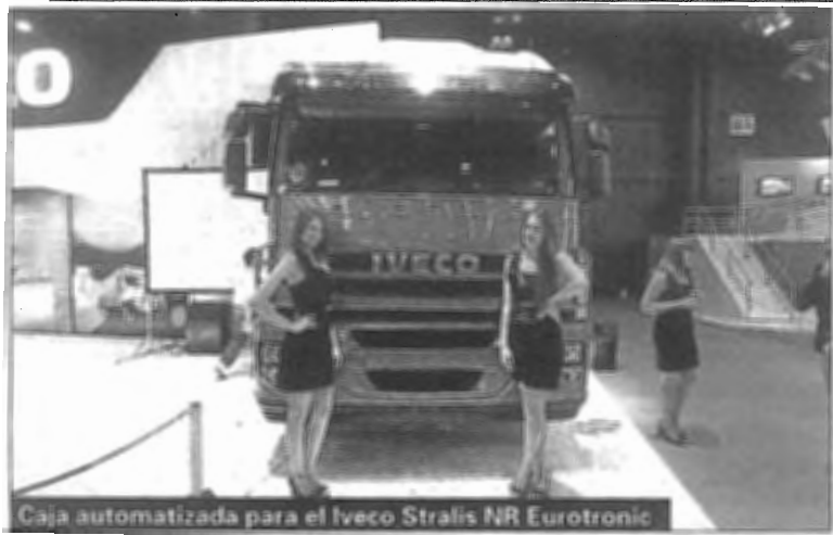
Caja automatizada para el Iveco Stralis NR Eurotronic