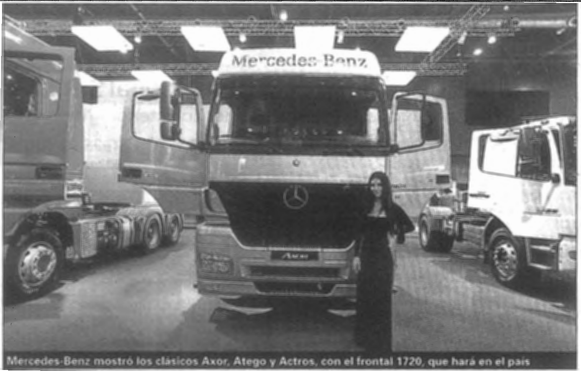
Mercedes-Benz mostró los clásicos Axor, Atego y Actros, con el frontal 1720, que hará en el país

lo convierte en el camión más potente del mercado argentino. Este modelo también derrocha tecnología de última generación con la transmisión Opticruise (automatizada, sin pedal de embrague ni selectora de cambios), y los dispositivos de ayuda a la conducción Driver Support y Retarder.