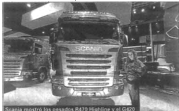
Scania mostró los pesados R470 Highline y el G420

En su stand de 300 m², Scania presentó como novedad el R Highline con motor V8 de 580 CV, cifra que