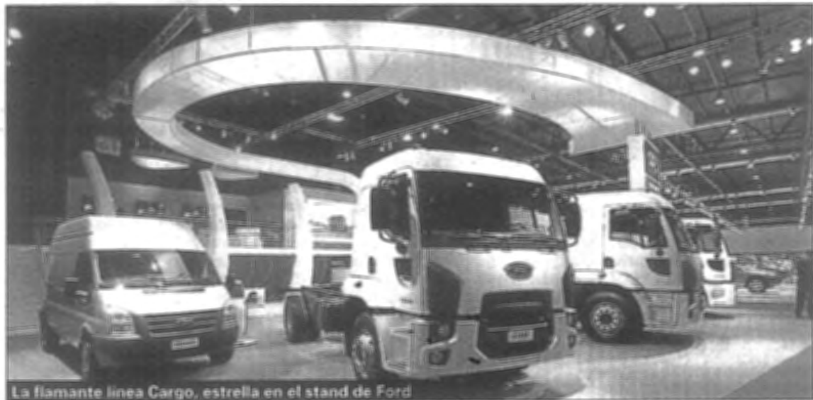
La flamante línea Cargo, estrella en el stand de Ford

Por su parte, Mercedes-Benz también mostró un nuevo producto: el frontal semipesado 1720, camión que se produce desde el mes último en el centro industrial Juan Manuel Fangio de Virrey del Pino. El 1720 es la punta de lanza de una ambiciosa inversión de 400 millones de pesos para producir en dicha planta un nuevo utilitario, chasis para ómnibus urbanos y la fabri-