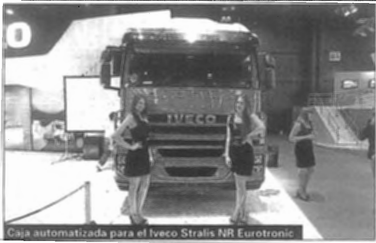
Caja automatizada para el Iveco Stralis NR Eurotronic