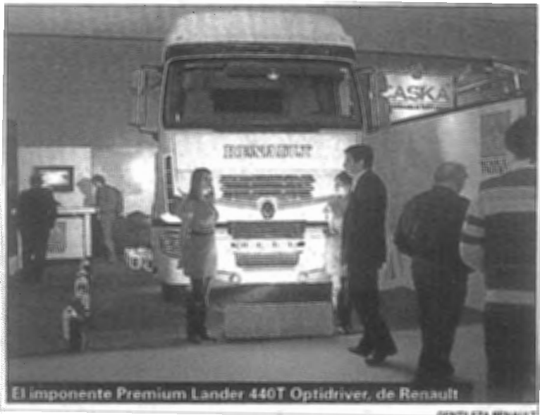
El imponente Premium Lander 440T Optidriver, de Renault