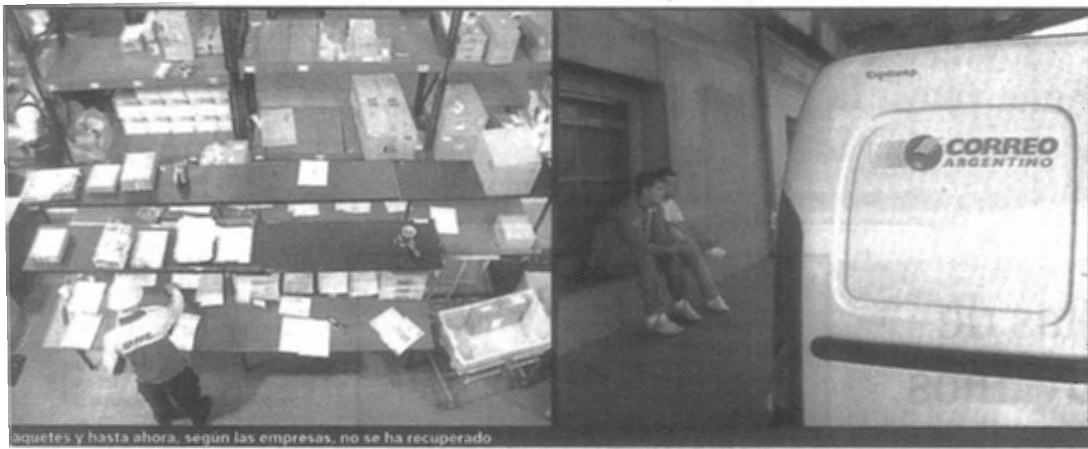
paquetes y hasta ahora, según las empresas, no se ha recuperado