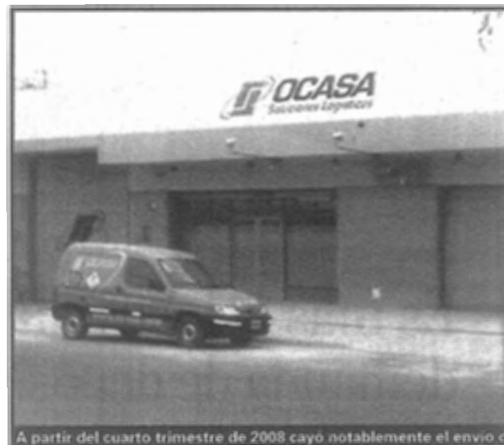
A partir del cuarto trimestre de 2008 cayó notablemente el envío de

de electrodomésticos, grandes tiendas; es decir, las áreas comerciales son las que te dan mucho volumen de envíos y luego los paquetes, el gran movimiento comercial; lo que ha caído mucho ha sido el paquete, que promedia entre un 30% y 40% se-