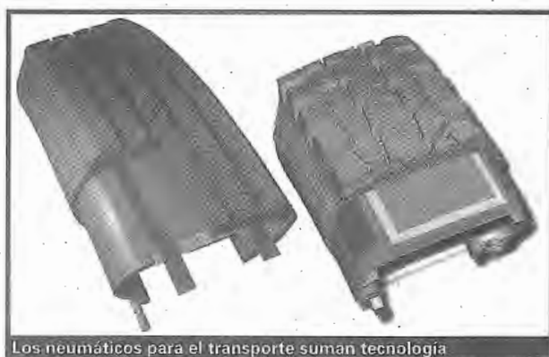
Los neumáticos para el transporte suman tecnología