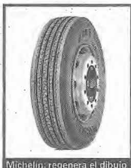
Michelin: regenera el dibujo