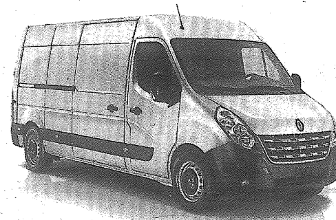
Muchos cambios exteriores

Con un diseño renovado, el nuevo Renault Master presenta cambios exteriores en toda el área frontal: faros, capot, parrilla y paragolpes. En tanto, el diseño interior ofrece mayor confort y funcionalidad. Su paragolpes posee nuevos "front steps" y proyectores antiniebla. También se destacan los repetidores laterales en los espejos retrovisores. En el interior se percibe un panel inspirado en el confort de un vehículo de pasajeros. Sobre el costo de utilización y mantenimiento, la marca francesa indicó que tiene un motor más potente, de 130 CV (15 CV más que la versión anterior) que reduce en un 3% el consumo de combustible. El costo de mantenimiento se redujo un 40 por ciento en 2 años.