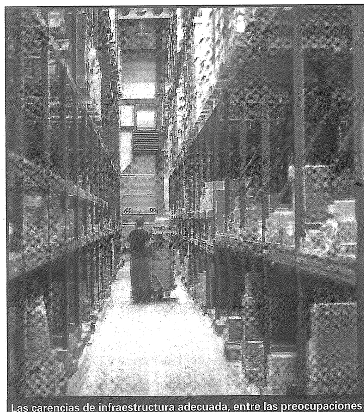
Las carencias de infraestructura adecuada, entre las preocupaciones