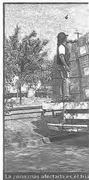
La zona más afectada es el triángulo

De Palma, de American Tracer, hace una diferenciación: en cuanto a robos de vehículos, no hay alguno entre los cien barrios donde predomine. "Si hay una diferencia en los de carga pesada, que se mueven por los corredores habilitados. Los lugares comunes para los atracos, son la salida del Puerto; subida a la Autopista 25 de Mayo; Cantilo y Av. General Paz, y algunos puntos de las autopistas donde los camiones bajan la velocidad, maniobran, o donde llaman poco la atención. Ya en provincia hay sitios también sensibles, como General Pacheco, Escobar, Pilar,