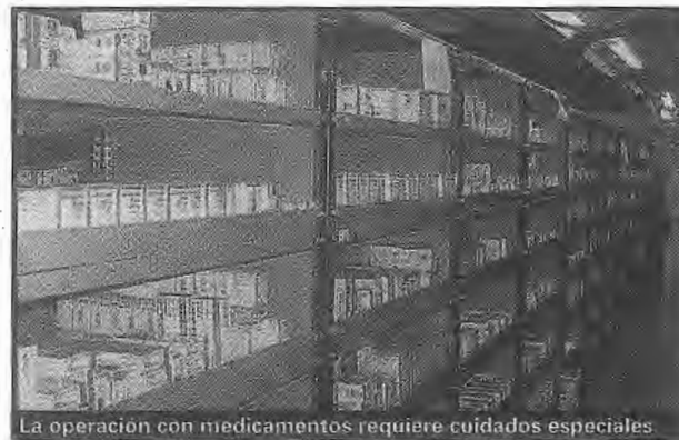
La operación con medicamentos requiere cuidados especiales