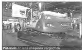
Potencia en una máquina cargadora