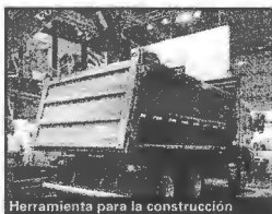
Herramienta para la construcción