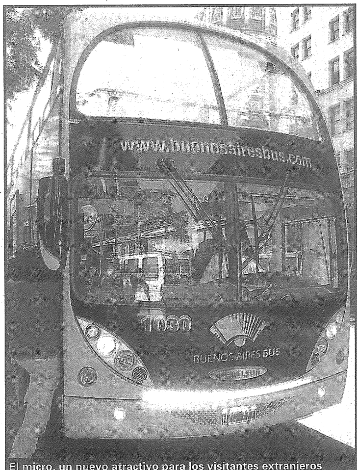
El micro, un nuevo atractivo para los visitantes extranjeros