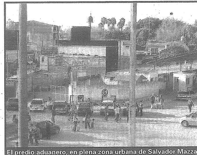
El predio aduanero, en plena zona urbana de Salvador Mazza

Los choferes deben esperar en la calle, porque no hay un lugar adecuado en el que tengan baños, seguridad y espacios para comer. Además, no pueden alejarse de la