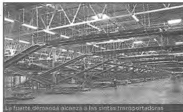
La fuerte demanda alcanza a las cintas transportadoras

En lo que no hay espacio para el diseno es en materia de precios, que se elevaron de un tiempo a esta parte, aunque no debido al alza de la demanda —como podría esperarse— sino a la influencia de los