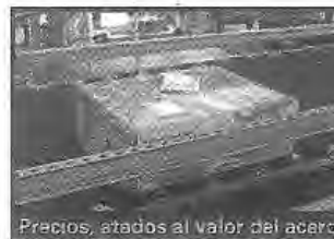
Precios, atados al valor del acero