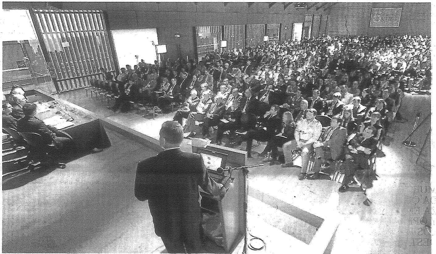
El encuentro de Cedol es una cita ineludible para los profesionales de la logística