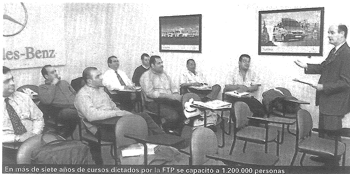
En más de siete años de cursos dictados por la FPT se capacitó a 1.200.000 personas

De regreso a Buenos Aires, ese año formamos catorce docentes que la IRU autorizó para dictar esos cursos. Participamos en 2009 y en 2010 en Bruselas de las reuniones ATI (Institutos Acreditados de Entrenamiento) de la IRU, de las cuales la FPT es la única en todo el continente americano.