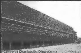
Centro de Distribución Dispreforma